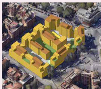
Modello 3D lotto II Trionfale II