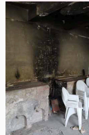
Foto lavatoi e stenditoi e angolo cottura.